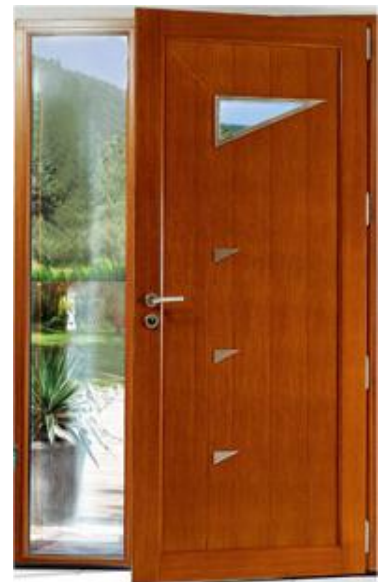
Portes, portails, rideau de fer, etc