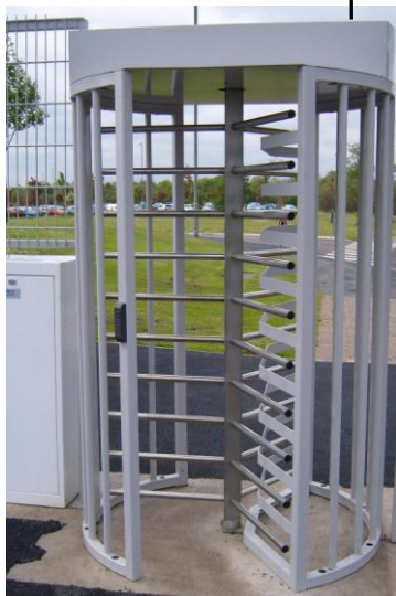
Tourniquets tous types